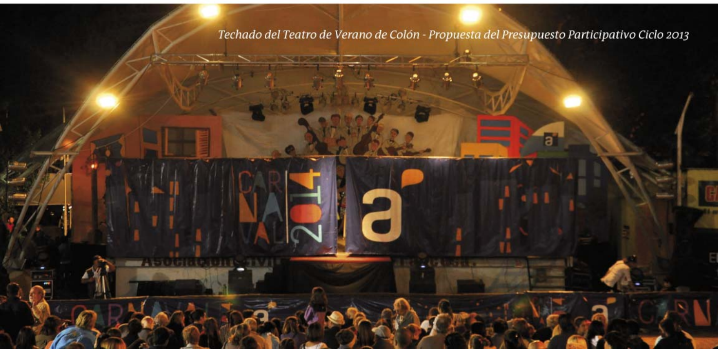
Techado del Teatro de Verano de Colón - Propuesta del Presupuesto Participativo Ciclo 2013

Podrán votar todos aquellos ciudadanos mayores de 16 años provistos de la Cédula de Identidad vigente.