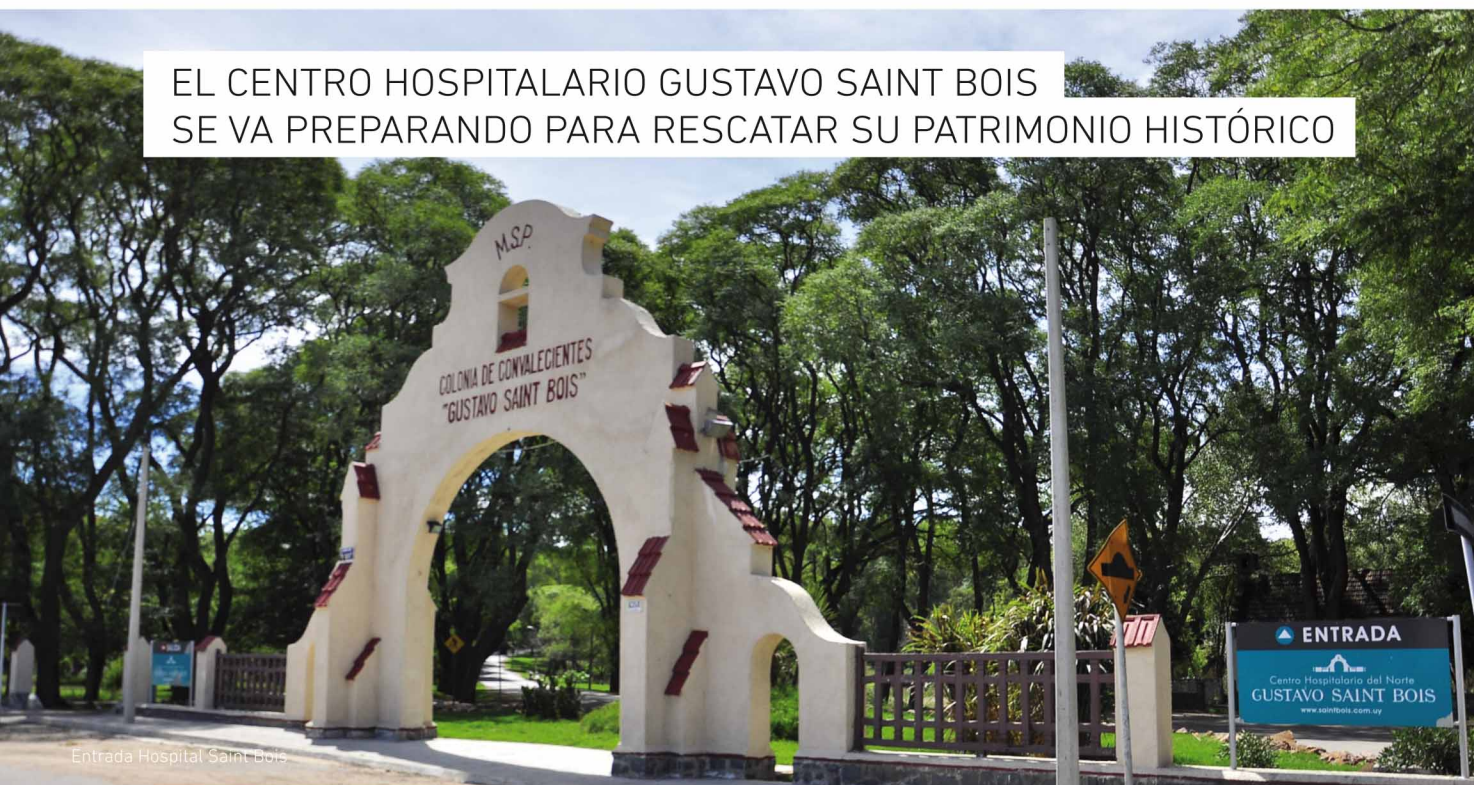
Entrada Hospital Saint Bois

E n el tan bonito como austero portal del CHN Gustavo Saint Bois reza el nombre original que tuvo este Hospital: "Colonia de Convalecientes". ¿Quiénes fundaron esta "Colonia"? En el período de esplendor del Batllismo, durante las dos primeras décadas del siglo XX se creó el sistema de administración de los hospitales públicos puramente estatal, bajo la égida de la Asistencia Pública Nacional ("APN") que comenzó a funcionar en febrero de 1911. Antes de la gestión de la "APN" todos los centros asistenciales existentes eran gobernados por "Comisiones de Caridad y Beneficencia Públicas", herederas de la antigua Hermandad de Caridad que creó el Hospital de Caridad entre los años 1787 y 1788.