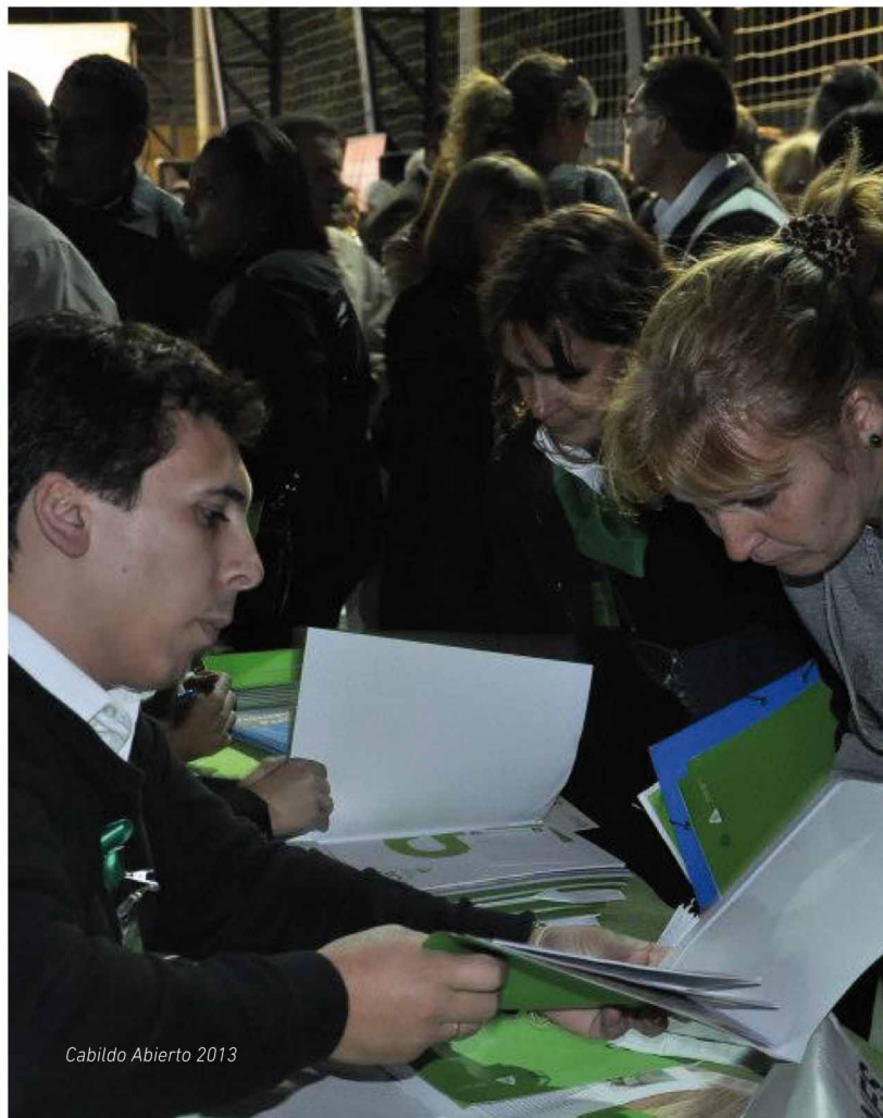
Cabildo Abierto 2013